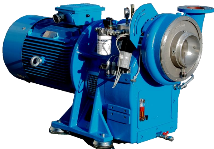
Показана модель в консольном исполнении с фланцевым электродвигателем В5