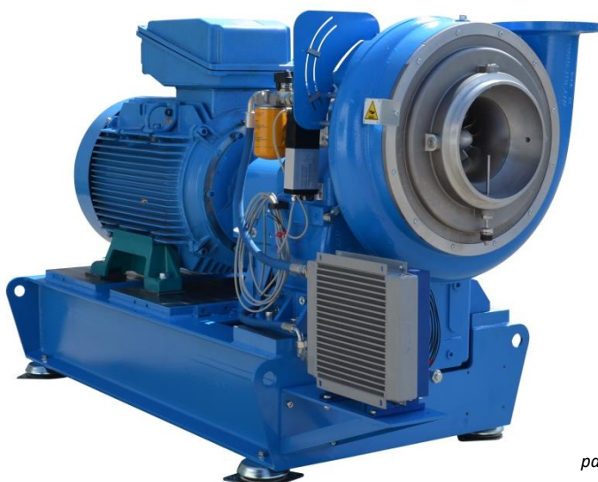
Показана модель с общей основной рамой и электродвигателем В3 на лапах