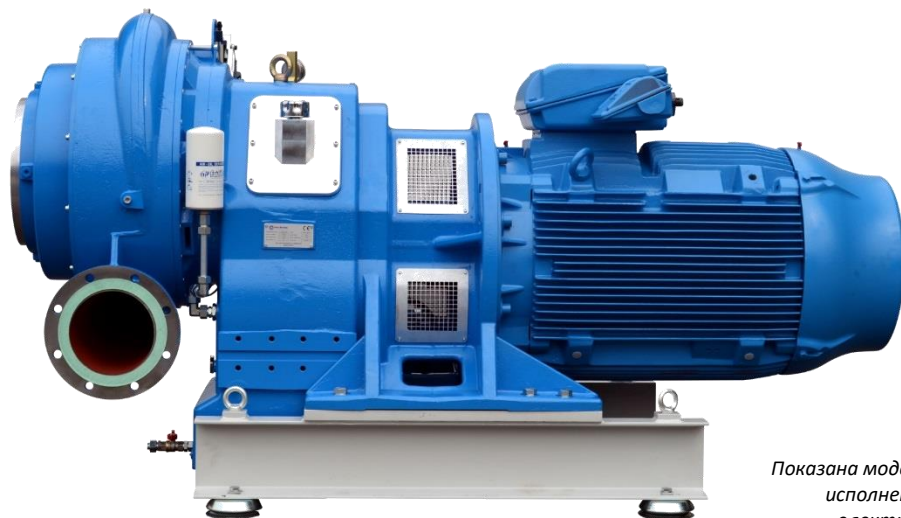
Показана модель в консольном исполнении с фланцевым электродвигателем В5