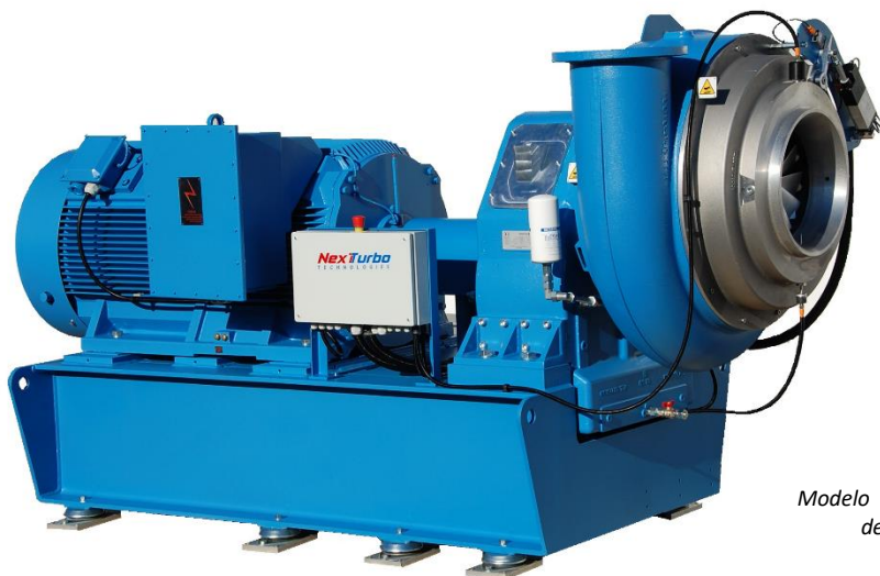
Modelo mostrado con configuración de motor con B3 y control XY