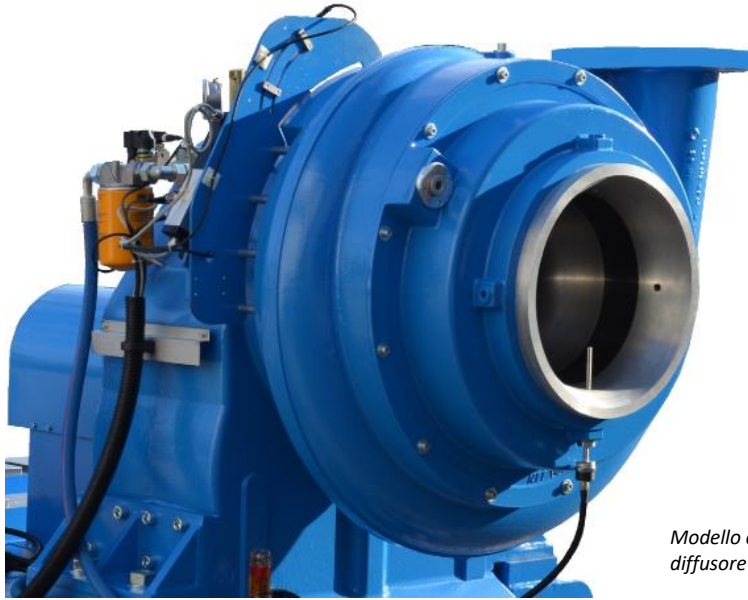
Modello configurato con basamento B3 e diffusore variabile X